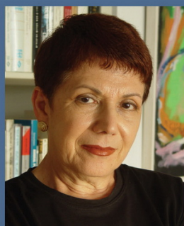
ציור: עמרי שפירא

פרופ' אניטה שפירא , כלת פרס ישראל לשנת 2008, לימדה שנים רבות באוניברסיטת תל אביב. בין ספריה: "המאבק הנכבד - עבודה עברית 1929-1939"; "ברל - ביוגרפיה"; "חרב היונה"; "יהודים חדשים, יהודים ישנים"; "יהודים, ציונים ומה שביניהם"; "גאל אלון - אביב חלד"; "ברנר - סיפור חיים".