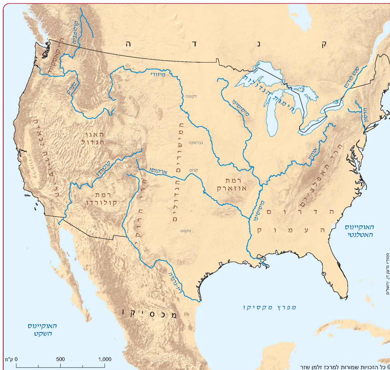
מפה פיזית של ארצות הברית

עצמאית שאינה סובלת ריסונים מיותרים – ובעקבות זה גם פיתוח יחס חשדני לחוקי המדינה. שפע המשאבים שעמדו לרשותו של כל מבקש אכן נטעו בטחון רב אצל המתיישבים, ורבים מהם ראו ברכה בעמלם והצליחו להתבסס כלכלית. היכולת לנוע הלאה מערבה נעשתה פיתרון לבעיות רבות, ועוררה את אווירת החיפוש אחר הזדמנויות. היא גם עזרה לטפח את המיתוס על אודות 'ארץ האפשרויות הבלתי מוגבלות' ו'חופש ההזדמנויות', כלומר – המחשבה שכל אחד יכול להצליח.