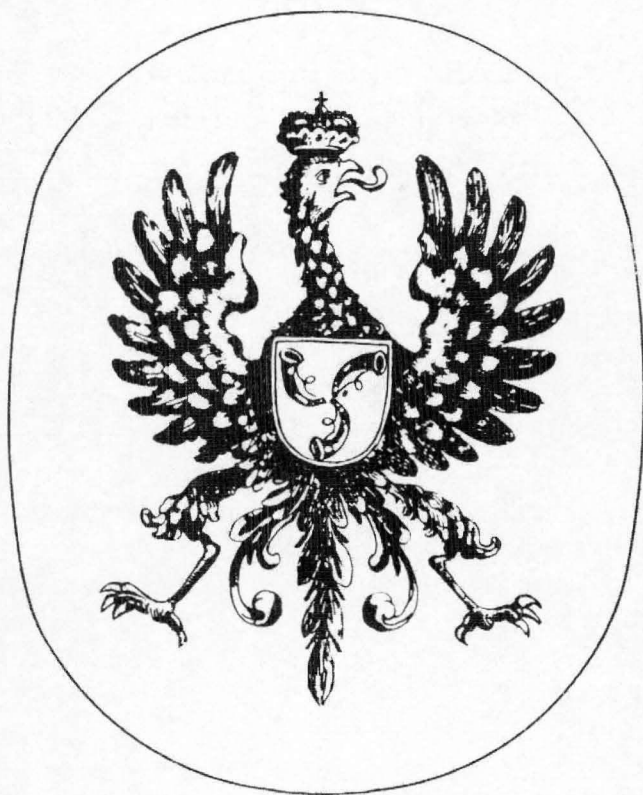
סמל משפחת רדז'יוויל (שלוש חצוצרות בתוך נשר)