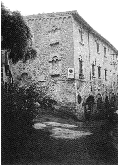
ביתו של ר' עובדיה מברטנורא

יחיאל, מחברו של המילון האנציקלופדי הראשון והיחיד במינו לתלמוד: 'הערוך'. הדרום שימש בתקופה זו מקום מפגש תרבותי, ודרכיהן של התרבות הלטינית, האיטלקית, הביזנטית, המוסלמית והיהודית הצטלבו בו. במפגש תרבויות זה מילאו היהודים תפקיד של מתווכים תרבותיים, במקרים רבים בחסותם של מלכים או של שליטים מקומיים אחרים. תיווך זה התבטא בעיקר בתרגומם הלטינית של ספרים יווניים,