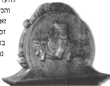
מצבה בבית הקברות בפדובה

והכיבושים השונים על היהודים. עם זאת, בקודקס תיאודוסיוס, אשר זכה לתפוצה ניכרת באיטליה באותן השנים, יש התייחסות נרחבת לשאלה היהודית, וממנו אנו למדים על נוכחות יהודית לא מבוטלת גם בתקופה זו. הכיבושים התכופים וחוסר הביטחון גרמו פיחות במעמדה