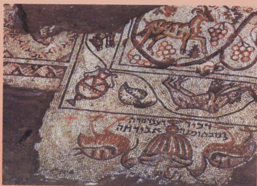
כתובת בפסיפס מבית הכנסת בבית שאן

העיסוק בשלטון העצמי היהודי הוא אפוא מן הנושאים המרכזיים ביותר בחקר תולדות עם ישראל, במיוחד לאחר צאתו לגלות. המגמה העיקרית של מחקרים אלה היא להביא בפני הקורא סיכום מעודכן של הממצאים העיקריים הקשורים באוטונומיה היהודית מזוויות ראייה שונות ומגוונות כדי שהתמונה הכוללת תהא בהירה ותמחיש את מלוא חשיבותה של התופעה, את התפתחותה ואת רב־גוניותה.