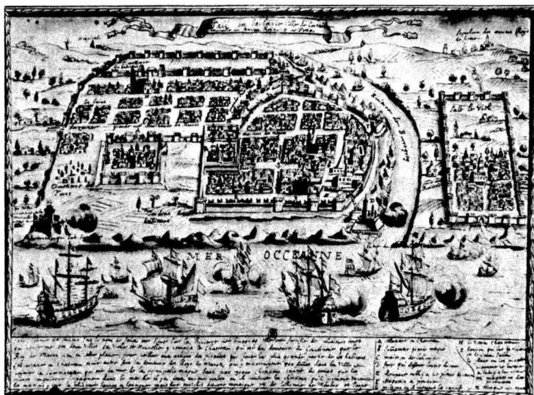
סלא או סאלי, בחוף האטלנטי של מרוקו.

3. המגורשים הגיעו לצפון אפריקה החל מחודש יוני 1492 — בהתאם לפקודת הגירוש. הם באו טיפין טיפין ולא כגל אחד, והגירתם נמשכה ללא הפסק עד לאמצע המאה ה-16, עם תקופות שיא אחדות בקיץ ובסתיו של 1492, ואחר כך לאחר שמד פורטוגל ב-1497, ואחרי כינון האינקוויזיציה בליסבון ב-1536.